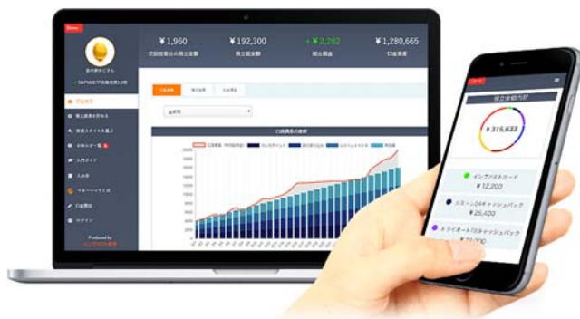
マネーハッチ画面イメージ

マネーハッチは、投資初心者の方でも投資を体感できるよう「元手資金ゼロから」「投資を体感できる」「シンプルだけど楽しめる柔軟性」を大切にしています。投資を体感することで、投資に関する知識や必要性、楽しさを学んでいただきたいと考えております。元手資金ゼロからの投資を可能にする仕組みは以下のとおりです。