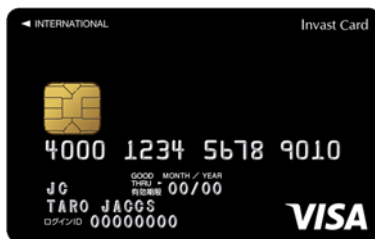
インヴァストカードイメージ

マネーハッチでは、インヴァスト証券発行のクレジットカード「インヴァストカード」のご利用時に貯まるポイント（還元率1%）を積み立て原資にすることができます。投資のために資金を用意することなく、元手資金ゼロから投資をスタートできることが特徴です。